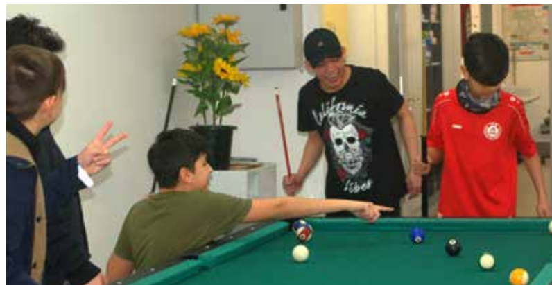
Der Billardtisch ist meistens dicht umlagert.