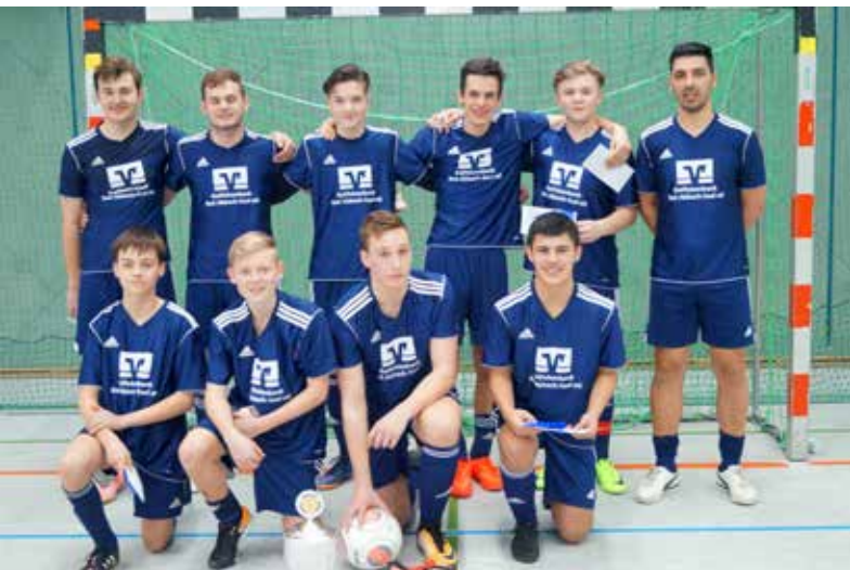
Die Siegermannschaft U17 der JFG-Donautal mit dem Pokal

Internationales Fußballturnier war wieder ein großer Erfolg