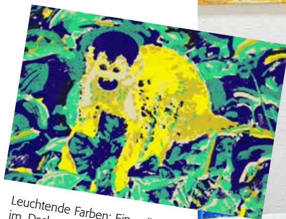
Leuchtende Farben: Ein gelber Affe im Dschungel. Das Bild ist in der Ausstellung „Tier & Landschaft“ zu sehen.

„Die Ausstellung ist für die Menschen im Landkreis außerdem eine gute Gelegenheit, nach Kaffee und Kuchen in unserem Bistro, das Haus einmal in Ruhe, ohne akute Notwendigkeit kennenzulernen. Für Fragen steht unser freundliches Personal dabei natürlich immer gerne zur Verfügung.“