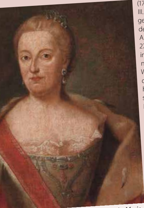
Machte eine Badekur in Abbach: Kurfürstin Maria Anna Sophie (Gemälde von George Des-marées).