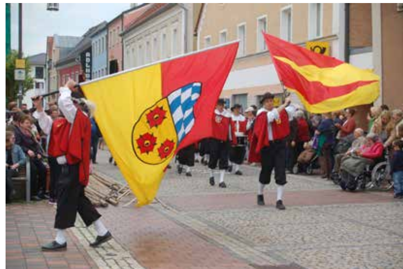
Fahnenträger u. Musiker gehen stets voran, z.B. beim Maibaum-Aufstellen

Beim Neujahrsanblasen ziehen die Musiker durch alle Ortsteile, spielen auch beim Maibaum-Aufstellen auf. Wenn sich eine Lösung findet, kann das so weitergehen – und nächstes Jahr gefeiert werden. Natürlich mit Trommel, Flöte und Fanfare – und vielleicht auch mit Bläsern! BvS