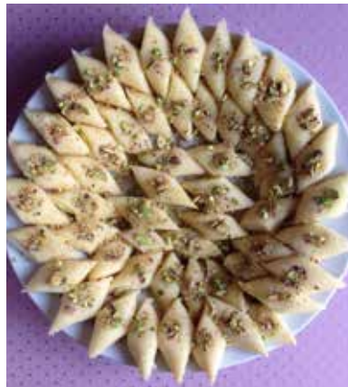
Eine köstliche Süßspeise mit Pistazien.