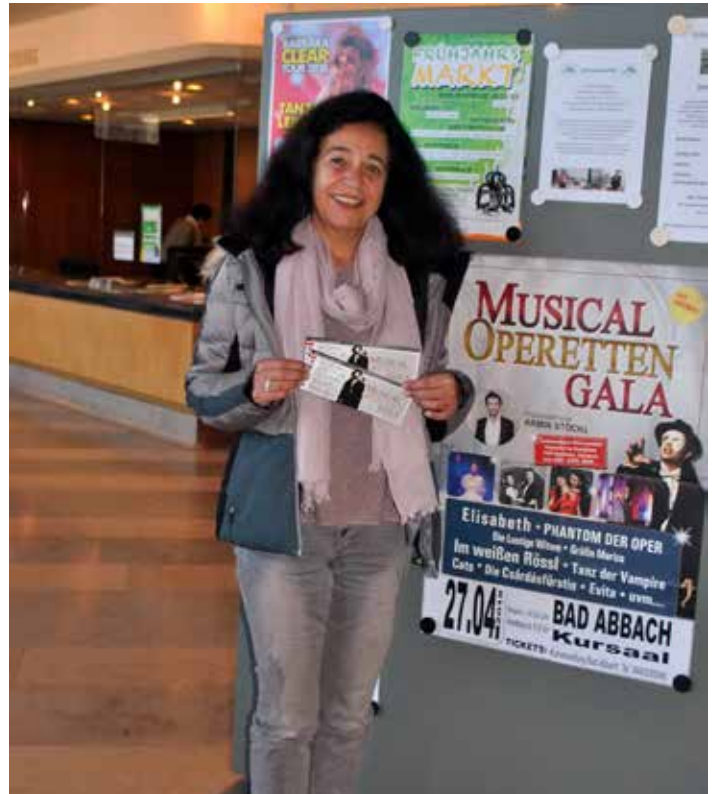
Gewann 2 Eintrittskarten für die Musical Operetten-Gala am 27. April im Kurhaus Bad Abbach: Elisabeth Klaus