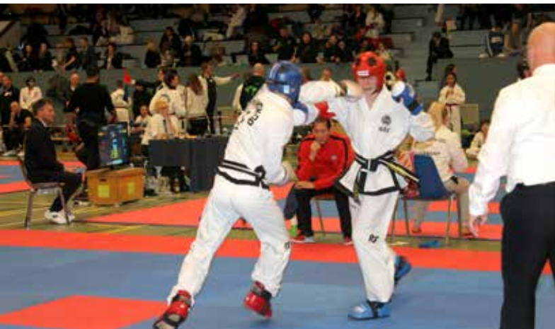
Vorgeschmack auf die EM Mitte April ...