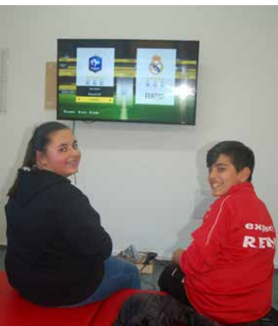
Zwei Kinder beim FIFA-Spielen

Kelheim. Der Kelheimer Jugendtreff hat ein neues Domizil: Er zog von der Weltenburger Straße zur Wittelsbacher Mittelschule an den Rennweg. Für 90.000 Euro wurde ein Nebengebäude, das früher Fahrradhalle war und während der Schul-Sanierung als Klassenzimmer genutzt wurde, auf Vordermann gebracht. Bürgermeister Horst Hartmann stellte den Jugendtreff nun mit Stadtbaumeister Andreas Schmid der Öffentlichkeit vor. An der neuen Ad-