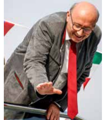
... ebenso der Landrat