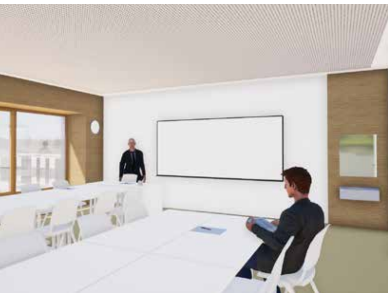
Hell und modern: Das künftige Klassenzimmer