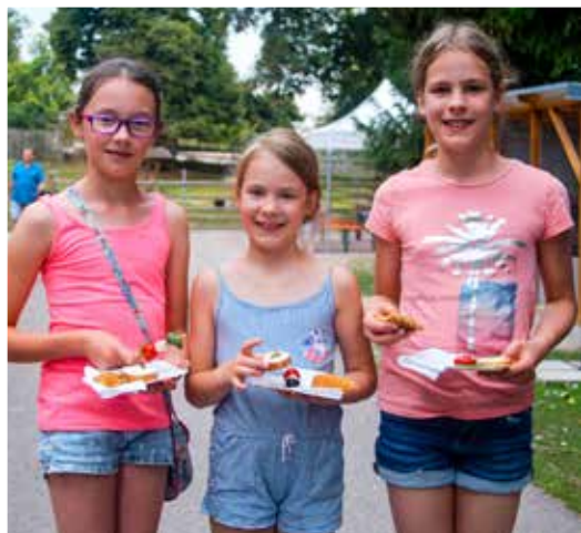
Käsespieße und Waffeln ließen sich diese drei Mädchen schmecken. Danach gab's Ziegenmilch-Honig-Eis.