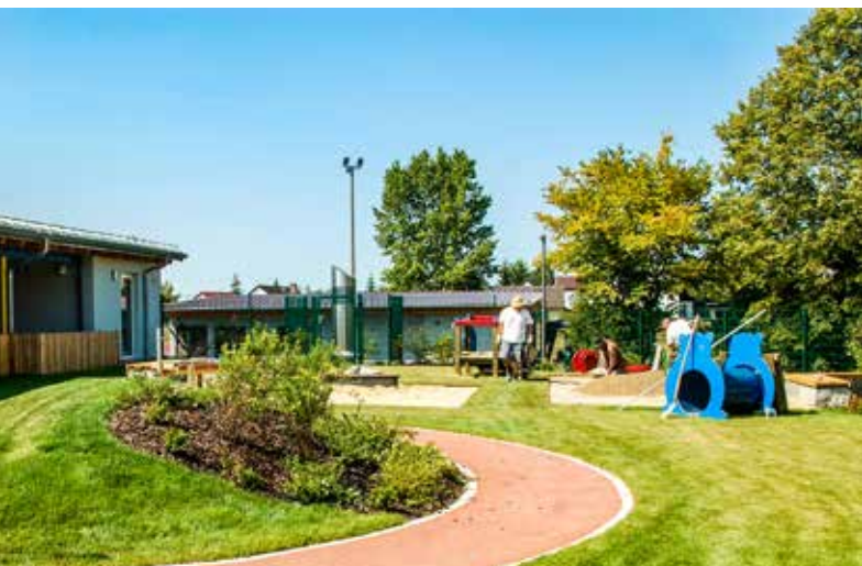
Letzte Handgriffe beim Installieren der Spielgeräte