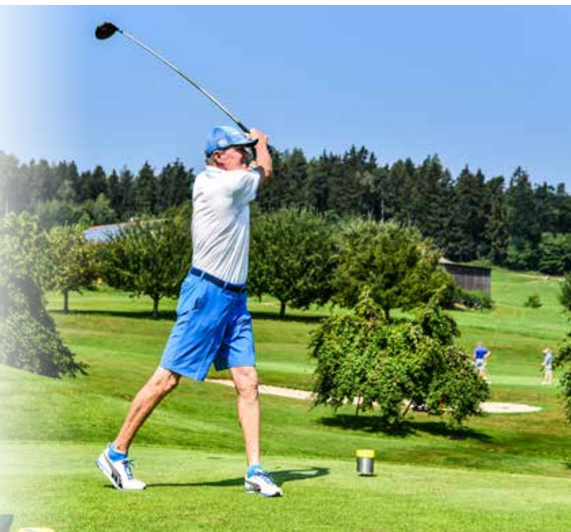
Trotz Hitze voller Schwung: Abschlag beim Turnier in Deutenhof

Beim Festabend spielte die Kapelle Josef Menzl, und ab 22 Uhr legte DJ Andreas Reisser auf.