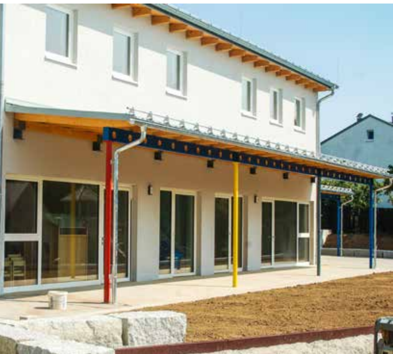
Auch der Holzzaun wird rechtzeitig zur Eröffnung fertig sein.