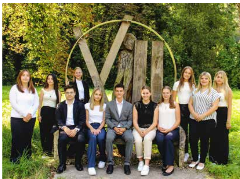
Die Auszubildenden der Raiffeisenbanken im Landkreis Kelheim

Die Raiffeisenbanken im Landkreis Kelheim sehen die Förderung des eigenen Nachwuchses als wichtigen Bestandteil ihrer Personalstrategie und legen großen Wert auf die praxisnahe Ausbildung.